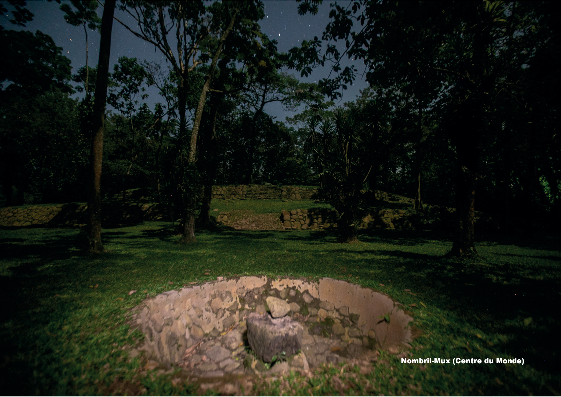
Nombriil-Mux (Centre du Monde)