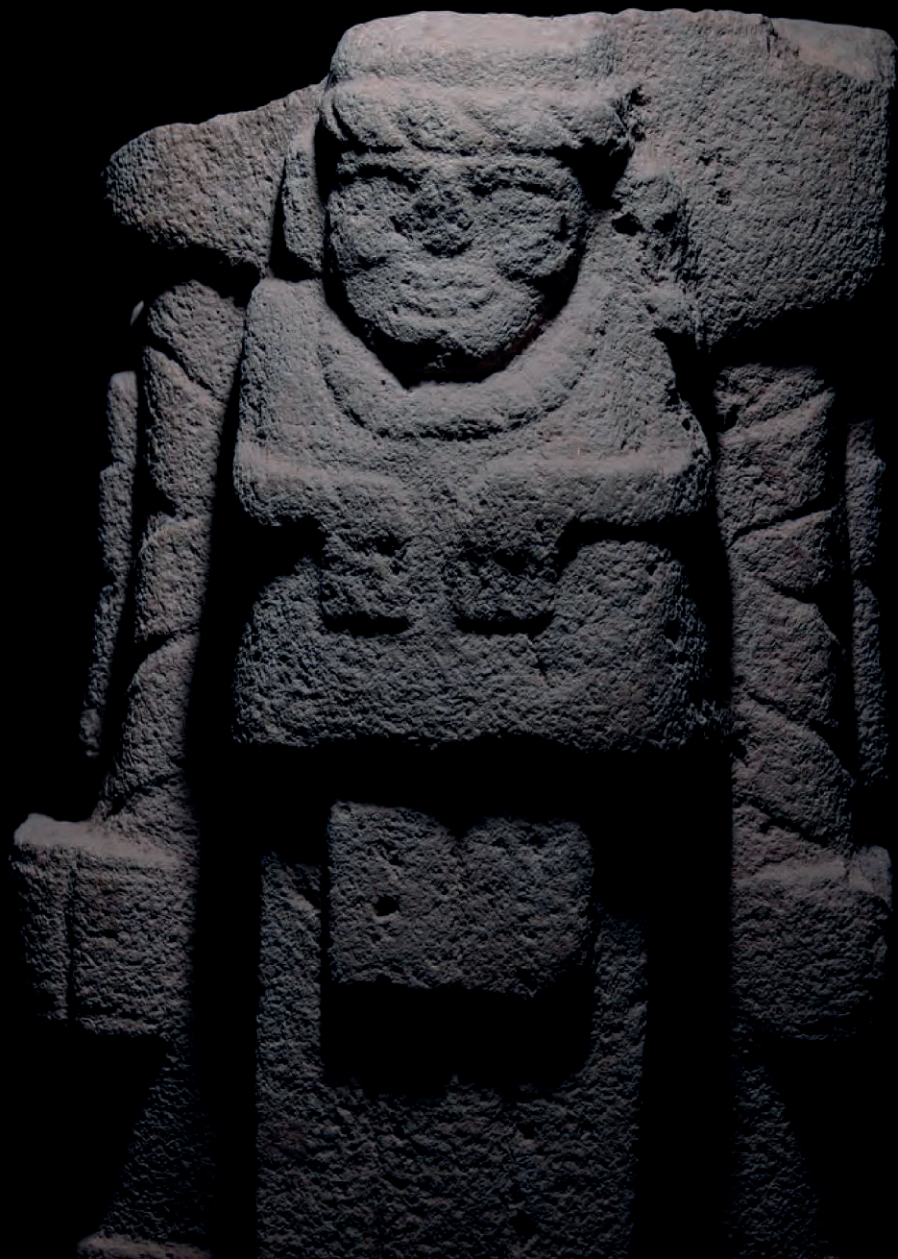
Sculpture "El Chargeur de l'Ancêtre"