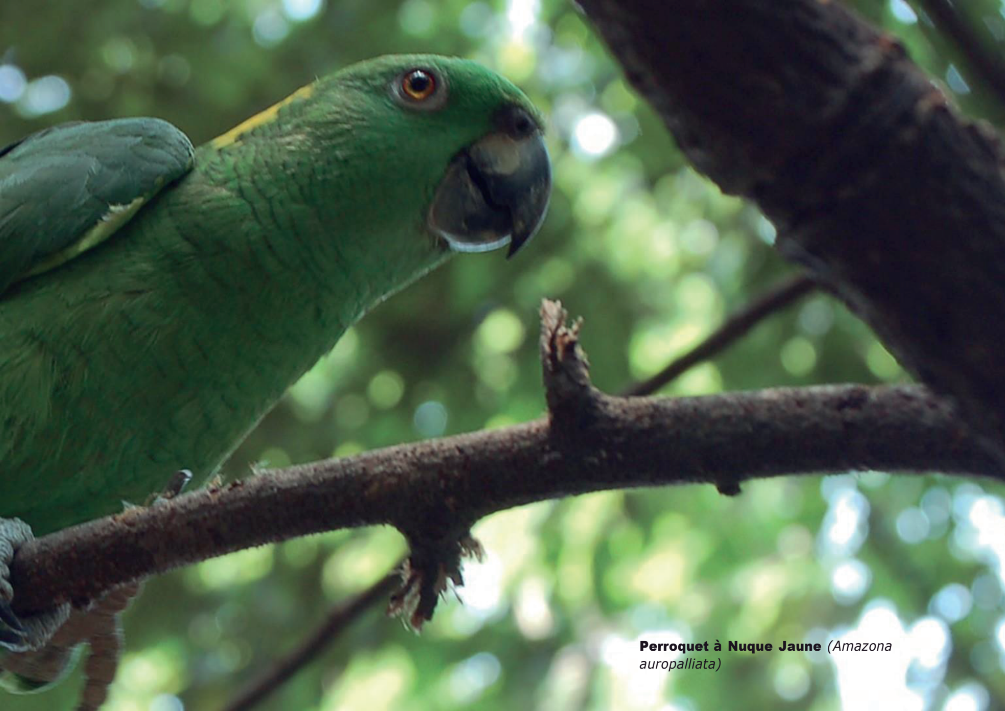
Perroquet à Nuque Jaune ( Amazona auropalliata )