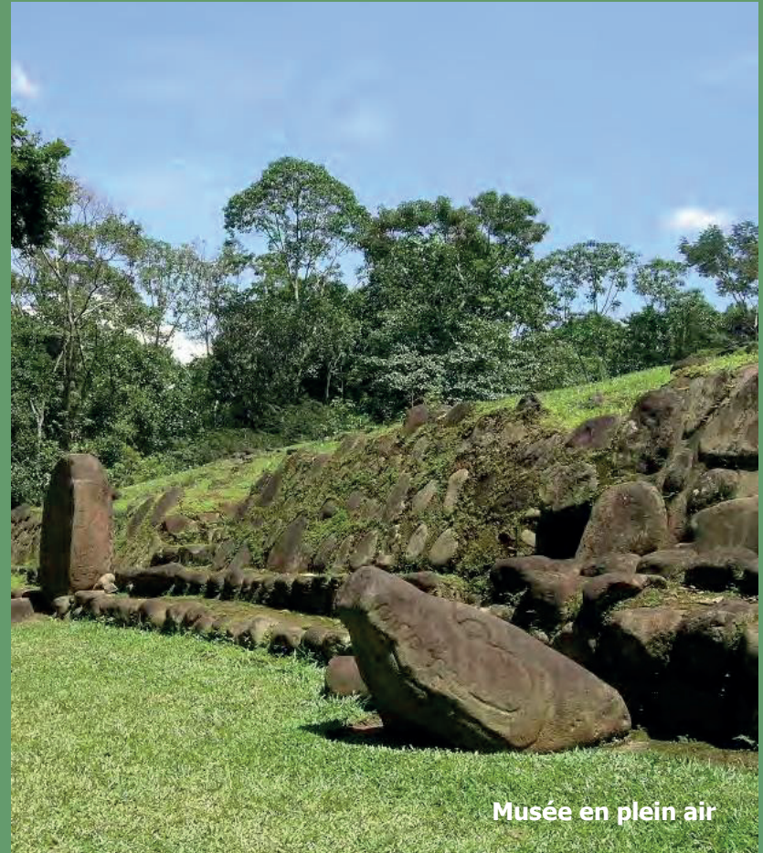
Musée en plein air

Le Chargeur de l'Ancêtre: C'est une sculpture unique qui représente un ancien dirigeant maya avec son ancêtre culturel olmèque sur le dessus, qui à son tour porte son ancêtre sur son dos.