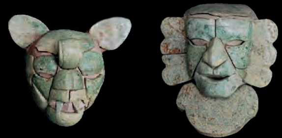
Têtes miniatures cérémonielles en mosaïque de jadéite