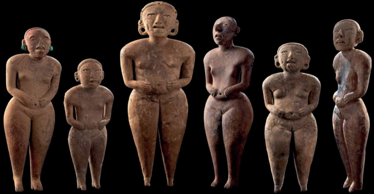
Offrande Funéraire "Les Poupées"