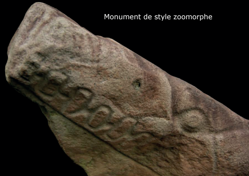
Monument de style zoomorphe

Transition culturelle: La transition des expressions culturelles d'olmèque à maya offre l'occasion unique d'observer le changement progressif de la pensée et la décision délibérée des premiers dirigeants d'entreprendre ces changements, ce qui est considéré comme exceptionnel dans l'histoire de la Mésoamérique.