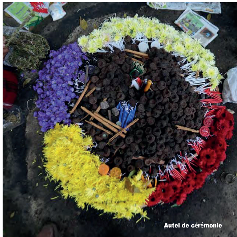
Autel de cérémonie

Dans le Parc se trouve l'un des monuments les plus anciens du site qui présente le cosmogramme ou croix K'an gravée dans la pierre. Actuellement ce symbole de croix est dessiné au début des rituels cérémoniels pour évoquer les ancêtres.